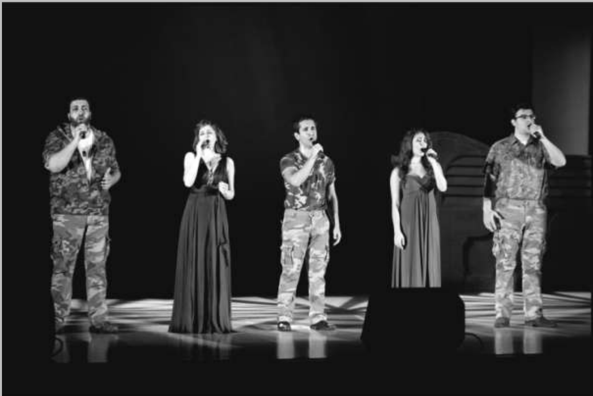
“HUYSER” Music Ensemble

221 East 27 th Street, New York, NY 10016 Tel: 212-689-5880 Fax: 212-889-1174 E-Mail: office@stilluminators.org Website: www.stilluminators.org